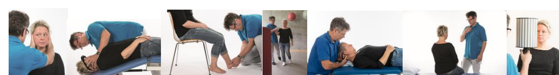
Daniel Bühler, Gockhausen, Schweiz, aus Schädler, Gleichgewicht und Schwindel © Elsevier GmbH, Urban & Fischer, München