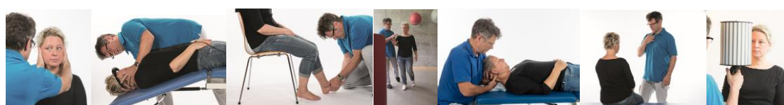
Daniel Bühler, Gockhausen, Schweiz, aus Schädler, Gleichgewicht und Schwindel © Elsevier GmbH, Urban & Fischer, München